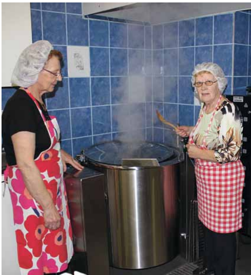
Mäenpään kylätalon keittiö remontoitiin toimivaksi Aisaparin hankerahoituksella.

Kylään liittyvät faktat kannattaa havainnollistaa taulukoiden, piirrosten, karttojen, kaavioiden ja vaikka valokuvien avulla, niin ne on helppo esitellä selkeällä tavalla yhteisissä kokoontumisissa. Silloin niistä myös helpommin poikii uusia ideoita.