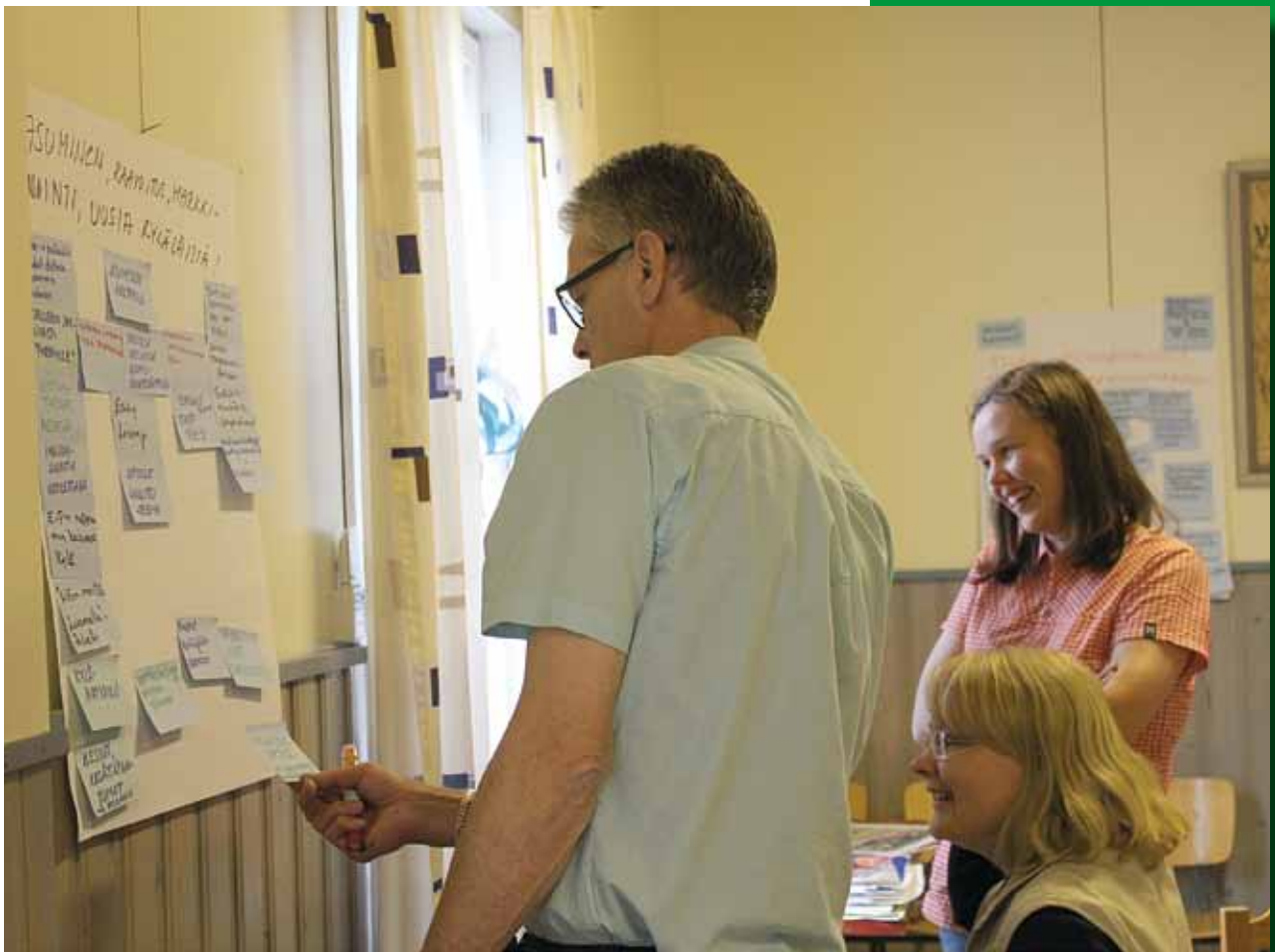
Tarralaput ovat käteviä, kun työryhmissä pistetään ajatuksia järjestykseen. Tutussa porukassa syntyy paljon ideoita vapaasti keskustellen.