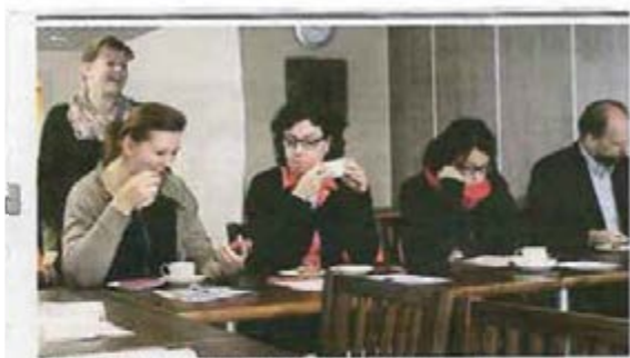
Etelä-Pohjanmaan Länsi-yhdistyksen ohjauksen ohjauksen pohdintajärjestöjen kehittämiskokous.

Määritellä tavoitteet niin, että niiden avulla ratkaistaan polttavimmat ongelmanne