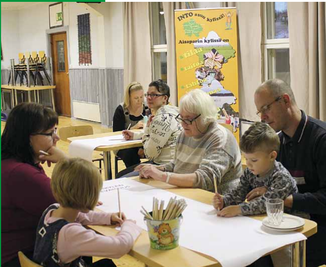
Unelmista totta -illassa Evijärven Särkikylässä suunniteltiin yhdessä mielenkiintoisia kylätapahtumia. Edustettuina olivat kaikki ikäryhmät.

Vaikka ajatukset olisivat hurjia, voi niiden joukosta löytyä se kultajyvä, josta voidaan jalostaa jotain ainutlaatuista oman kylän parhaaksi.