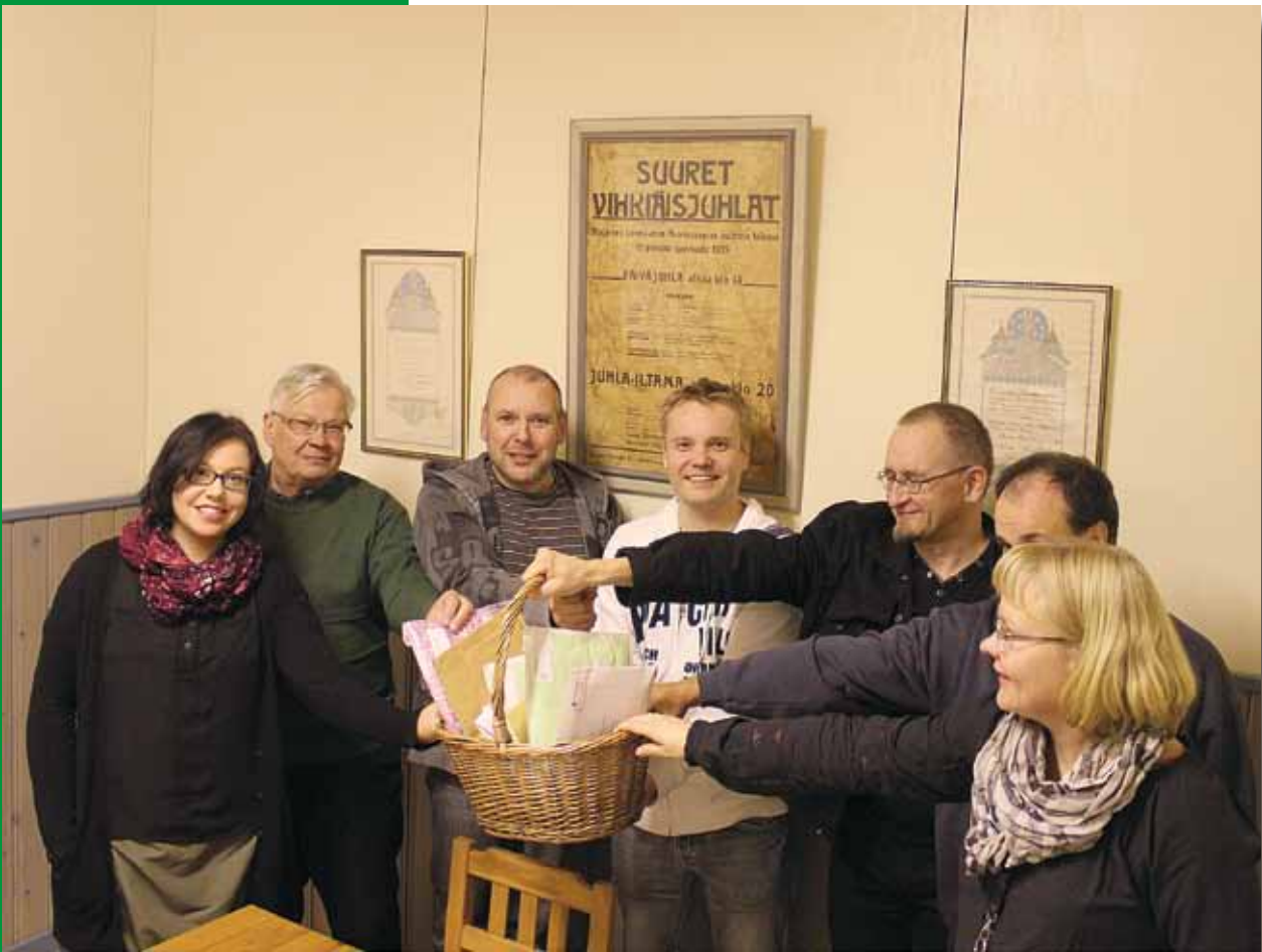
Luoma-ahon valtakunnallinen kyläelokuvafestivaali on rakentunut usean tahon yhteistyönä.

Mukava yhteistyömuoto on pelkkä KYLÄILY: käydään tervehdimässä naapureita, tehdään retkiä ja vierailaan naapurikyläien tapahtumissa. Parhaat ideat ja yhteiset toimintamallit syntyvät usein vapaamuotoisen jutustelun lomassa.