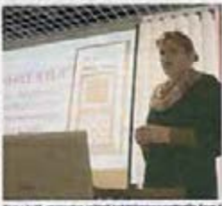
Paree kylä -strategian osittain kehittämiskokouksella Teu v J.

Etelä-Pohjanmaan Länsi-yhdistyksen ohjauksen strategiatyö on ollut pohdittuun. Länsi-yhdistyksen ohjauksen strategiatyö on ollut pohdittuun.