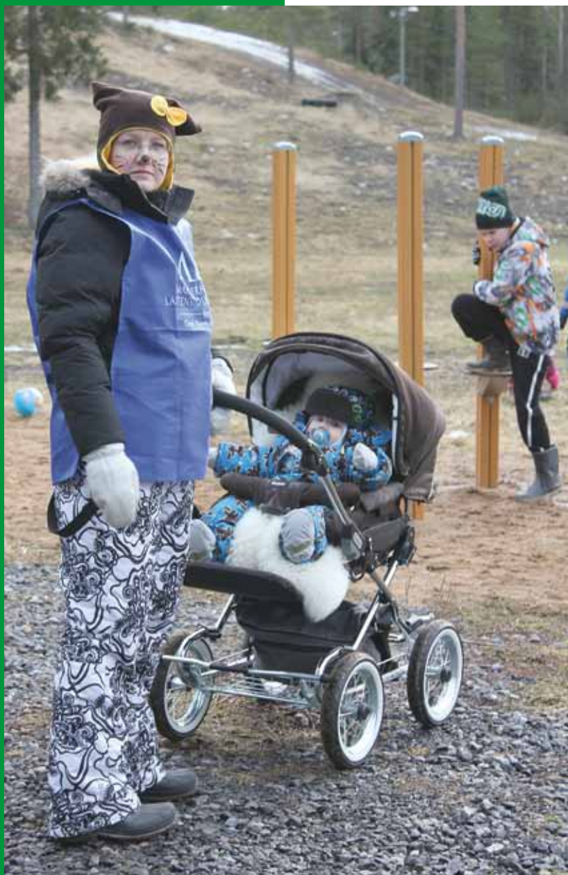
Kitkan ulkoilualueella pidettiin perheiden yhteinen talvipäivä.

Vastausten antamiseen pitää olla monta reittiä: kyläkysely kannattaa toteuttaa sekä postilaatikkokäkeluna että sähköisenä kylän kotisivulla tai facebookissa. Kyselyn lopussa olisi hyvä olla yhteystenkilön nimi ja puhelinnumero, johon voi tarvittaessa antaa soittamalla-kin tietoa.