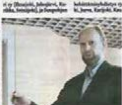
Paree kylä -strategian osittain kehittämiskokouksella Teu v J.

Etelä-Pohjanmaan Länsi-yhdistyksen ohjauksen strategiatyö on ollut pohdittuun. Länsi-yhdistyksen ohjauksen strategiatyö on ollut pohdittuun.